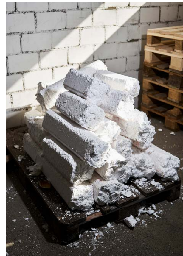
Gian Kälin verkleinert das Styropor des Verpackungsmaterials maschinell. ▶